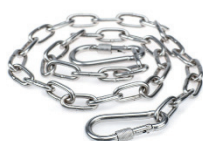
Aufhängung 1m Kette+ 2 Stück Karabiner