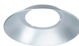
Reflektor Aluminium 120°